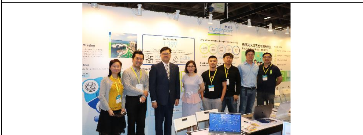
[圖四]: 數碼港聯同六間初創企業出席「澳門國際新創週」,展示初創解決方案並尋找商機。