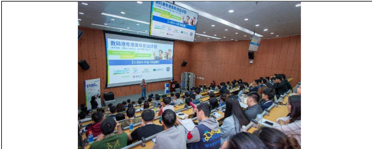
[圖五]:「數碼港大灣區青年創業計劃」將安排粵港澳三地青年參加創業營，學習最新科技及營商知識，並為爭取「數碼港創意微型基金」作準備。圖為 2018 年「數碼港粵港青年創業計劃」於深圳大學舉辦創業營的情況。