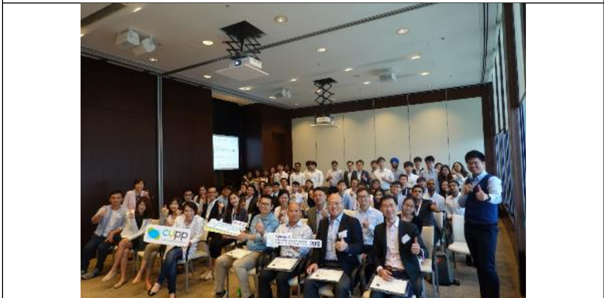
[圖四]: 參與「數碼港·大學合作夥伴計劃 2019」的同學，由 7 月初開始，一連六星期接受連串金融科技培訓。