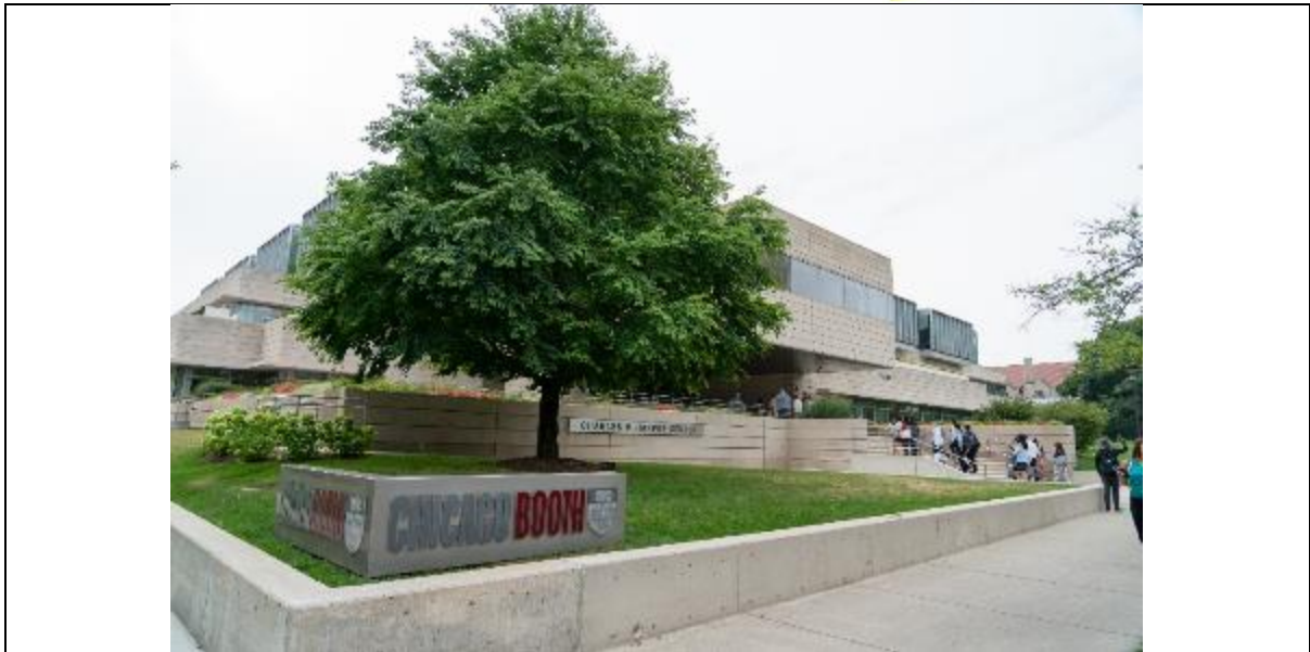
[圖三]: 美國芝加哥大學布斯商學院連續第二年成為「數碼港·大學合作夥伴計劃」的合作夥伴。該校為美國其中一家歷史最悠久的商學院。